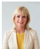
Ulrike Scharf, MdL Mitglied des Landtages und Bayerische Staatsministerin für Familie, Arbeit und Soziales